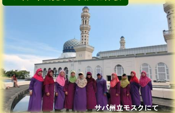
サバ州立モスクにて