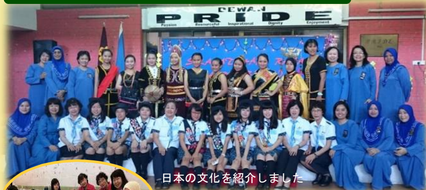
日本の文化を紹介しました