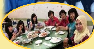
地元のレストランで