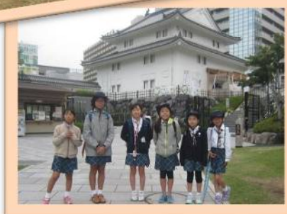
坤櫓(ひつじさるやぐら)を見学