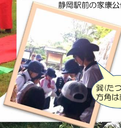
巽(たつみ)の方角は南東