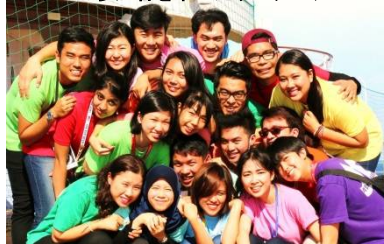
300人以上の参加者を率いたリーダーチーム