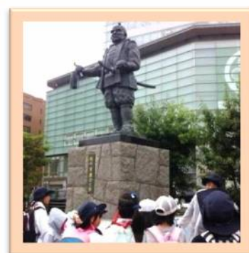
静岡駅前の家康公像