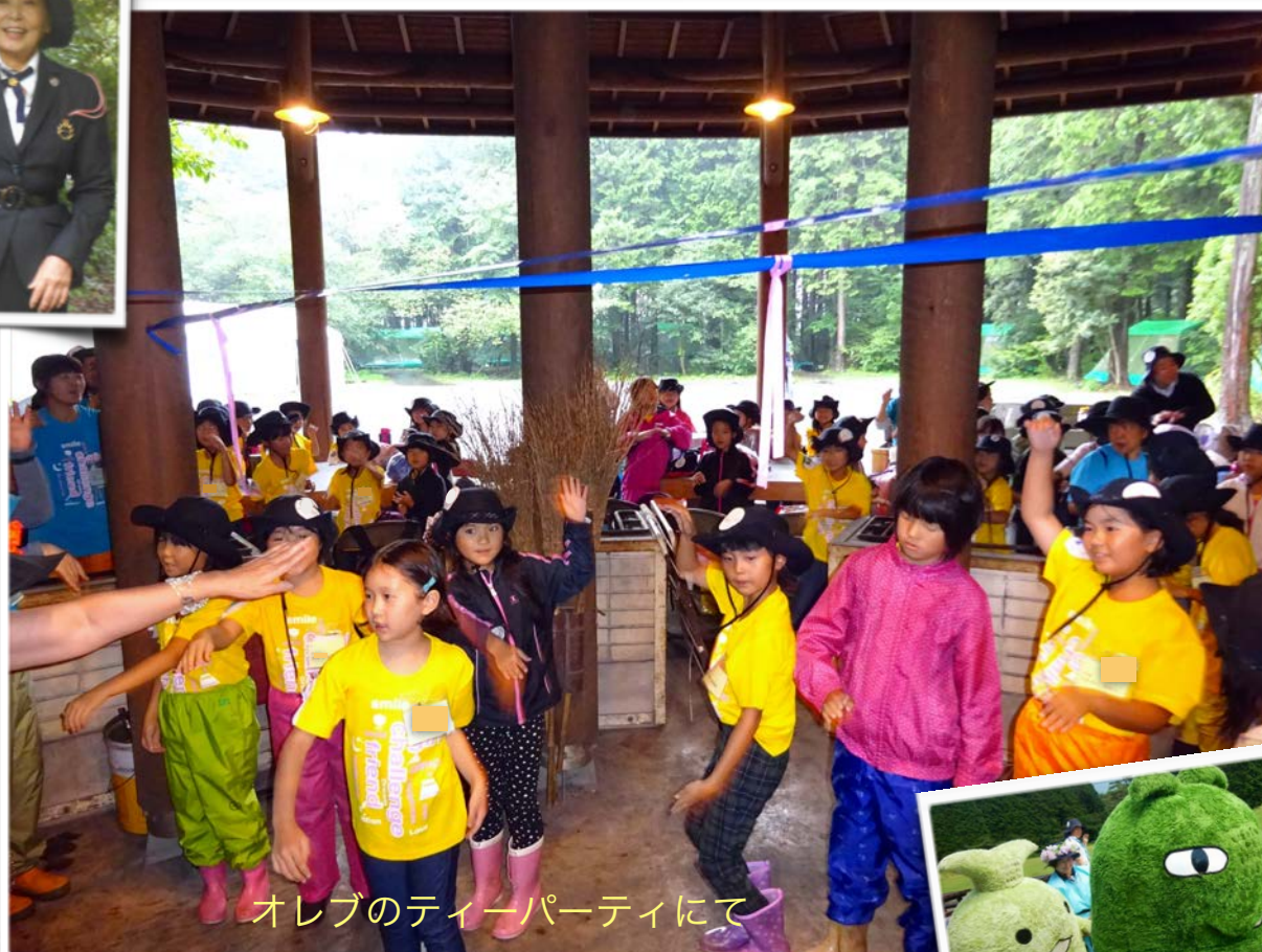
オレブのティーパーティにて